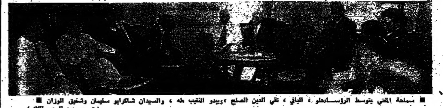
ساحة التي يتوسطها الزملاص، وهي التي التقى فيها الكولونيل المخطفوف مع شخصي الزمان